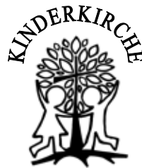
St. Michael & St. Paulus Gemeinsam Leben, Glauben, Wachsen.