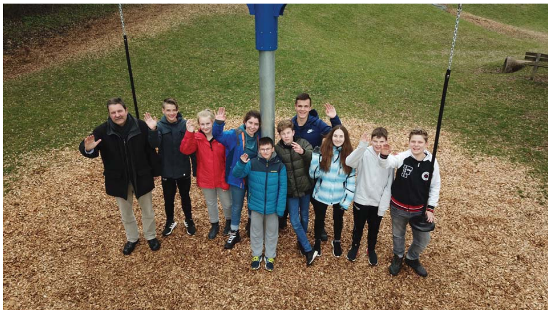
Bei der Konfirmandenfrelzeit im April 2019