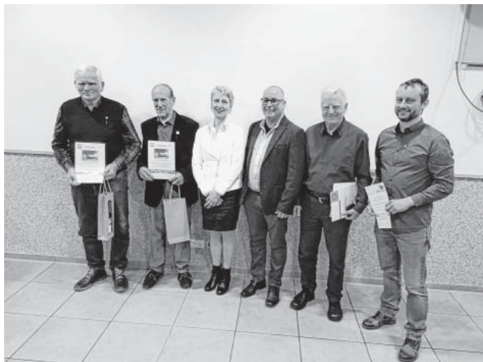
Die Geehrten des OGV Kohlberg-Kappishäusern