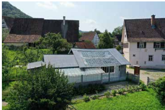
Das einzigartige Fotoatelier steht am 28. Mai im Freilichtmuseum Beuren im Mittelpunkt.

Das mehr als hundert Jahre alte Fotoatelier wurde in einem Kirchheimer Garten wiederentdeckt und anschließend in das Freilichtmuseum Beuren transloziert. Schließlich wurde dieses einzigartige Kleinod der Fotogeschichte 2003 feierlich an seinem heutigen Standort wiedereröffnet. Wer noch Fotos, Presseberichte oder persönliche Andenken an das Fotoatelier hat, kann diese gerne zum Hausbesuch mitbringen und damit die Spurensuche bereichern.