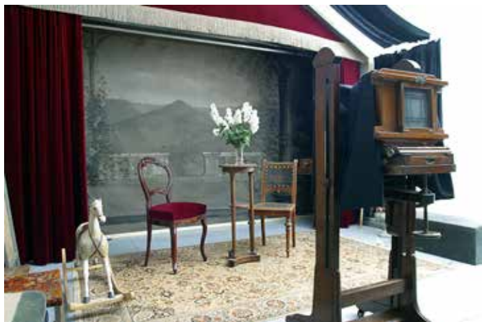
Das Fotoatelier im Museumsdorf beeindruckt mit seiner rund 100 Jahre alten Originalausstattung.