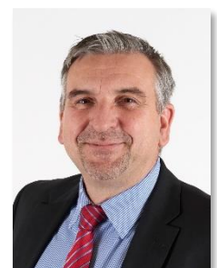
Rainer S. Taigel, Bürgermeister